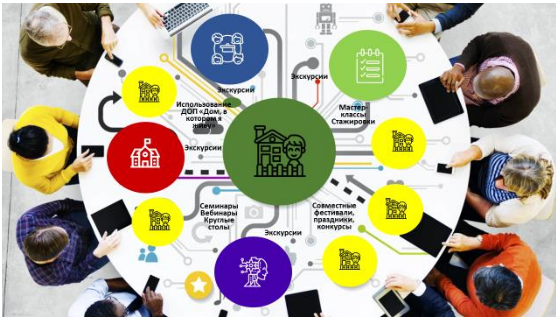
Рисунок 4. Модель взаимодействия с сетевыми партнерами