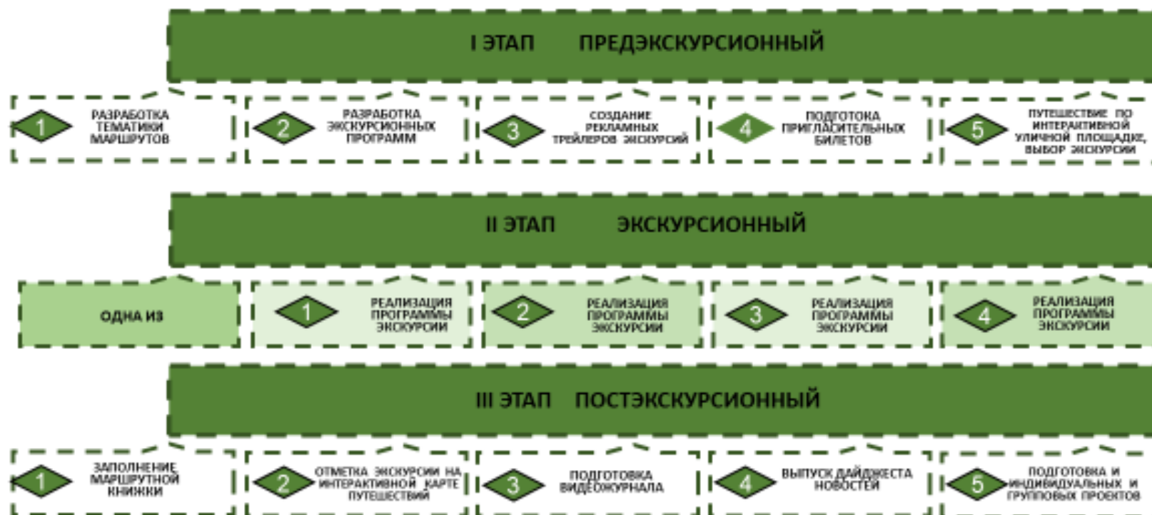
Рисунок 3. Образовательный цикл экскурсионной деятельности